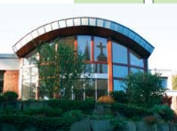
Haus der Stille