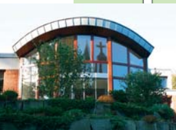
Haus der Stille